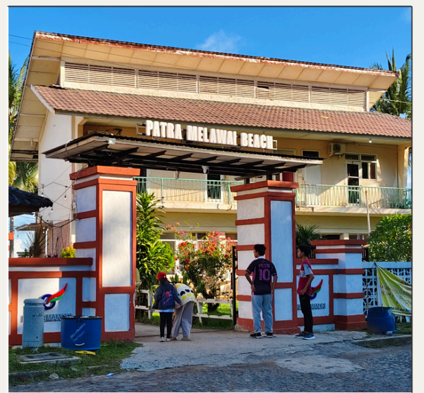
Cafe Kilang Mandiri RT 16