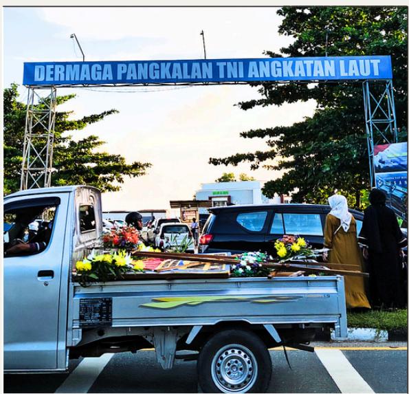
Dermaga Lanal RT 16