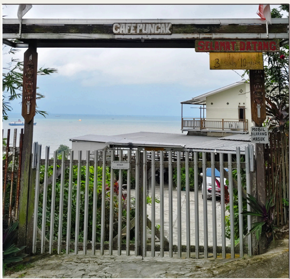
Cafe Puncak RT 12