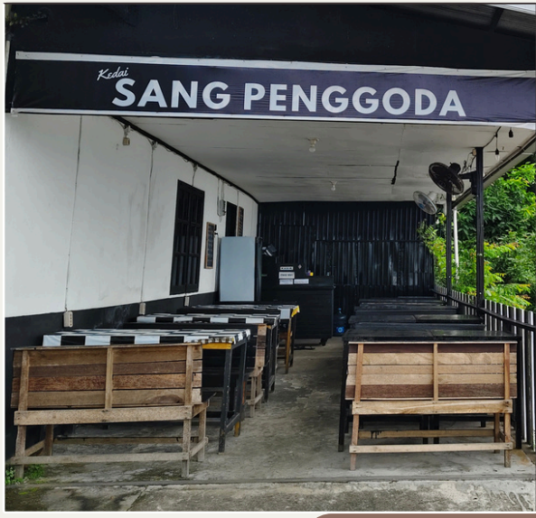
Cafe Sang Penggoda RT 12