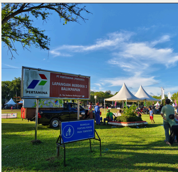
Lapangan Merdeka RT 16